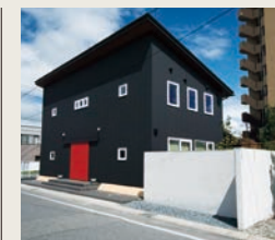
米沢市金池展示場