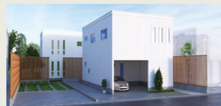
スマートユニテ 山形市平清水 2展示場