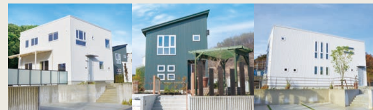
山形市蔵王みはらしの丘 3展示場